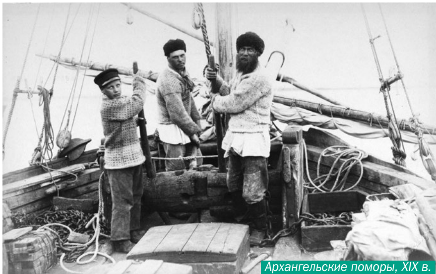
Архангельские поморы, XIX в.

Внутри единой поморской идентичности находятся тесно сопрягающиеся друг с другом северная, архангелогородская, двинско-заволочская, новгородско-финно-угорская идентичности. Последние две существуют преимущественно в культурно-исторической памяти (в частности, представленной большим числом финно-угорских топонимов), в музейных