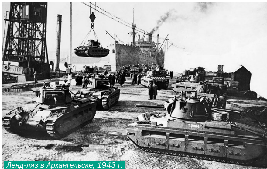
Ленд-лиз в Архангельске, 1943 г.

лизу: техникой, вооружением, военными материалами и оборудованием.