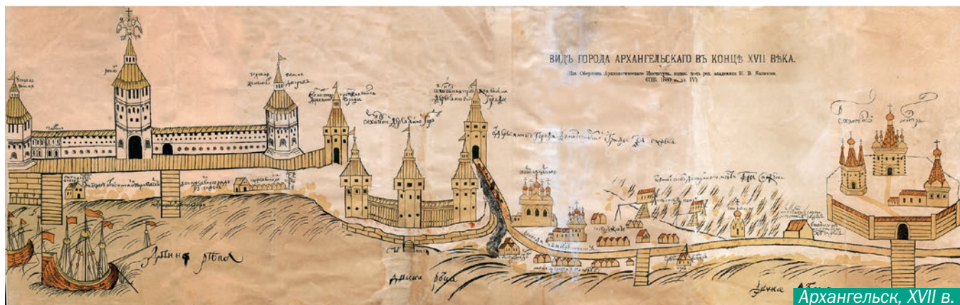
Архангельск, XVII в.

Общероссийский идентичностный пласт Архангельска складывается из таких «ячеек», как «окно в Европу / в мир», «северный форпост России», «ворота в Арктику», «всесоюзная лесопилка», «столица Северного морского пути». По мнению многих наших собеседников, Архангельск оказывался нужен стране и получал дополнительный импульс к развитию только в самые трудные для России времена. В период Северной войны в Архангельске появляется Новодвинская крепость. В Континентальную блокаду начала XIX века город на Северной Двине превращается в единственный порт, куда тайно, но массово приплывают британские торговые корабли. В Первую мировую войну Архангельск принимает тысячи тонн грузов с оружием и амуницией от союзников России по Антанте. В период Второй мировой сюда приходят конвои союзников с грузами по ленд-