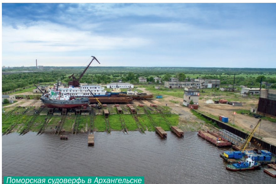
Поморская судостроительная верфь в Архангельске

Но даже в своей вынужденной изменчивости и разрозненности архангелогородцы стремятся обрести позитивные импульсы. Они сумели произвести на свет богатейшую и динамично развиваю-