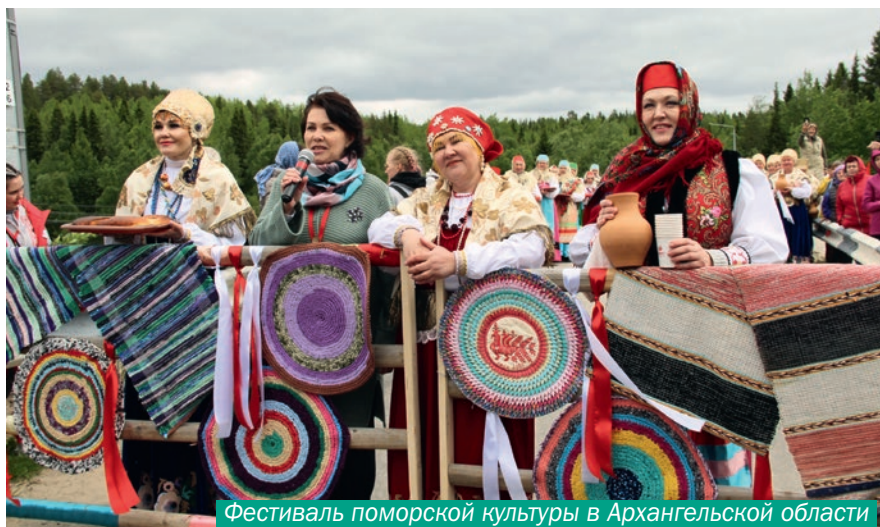
Фестиваль поморской культуры в Архангельской области

В настоящее время поморская грань остается актуализированной лишь в коммерческих и культурно-проектных брендах, а также в полуофициальном названии Архангельской области как Поморья. «Я думаю, что тема поморской идентичности, — резюмирует Верещагин, — это все же упущенная